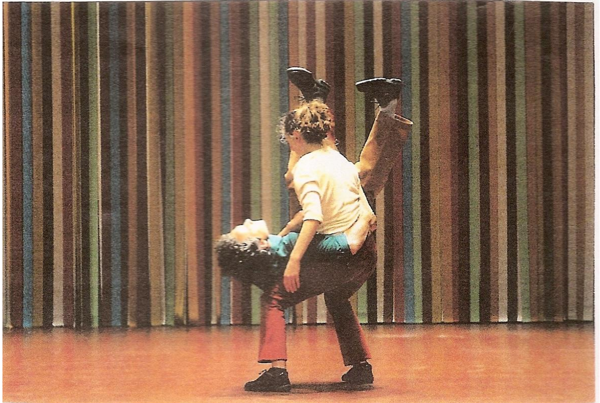
Les Applaudissements ne se mangent pas, 2002 Maguy Marin