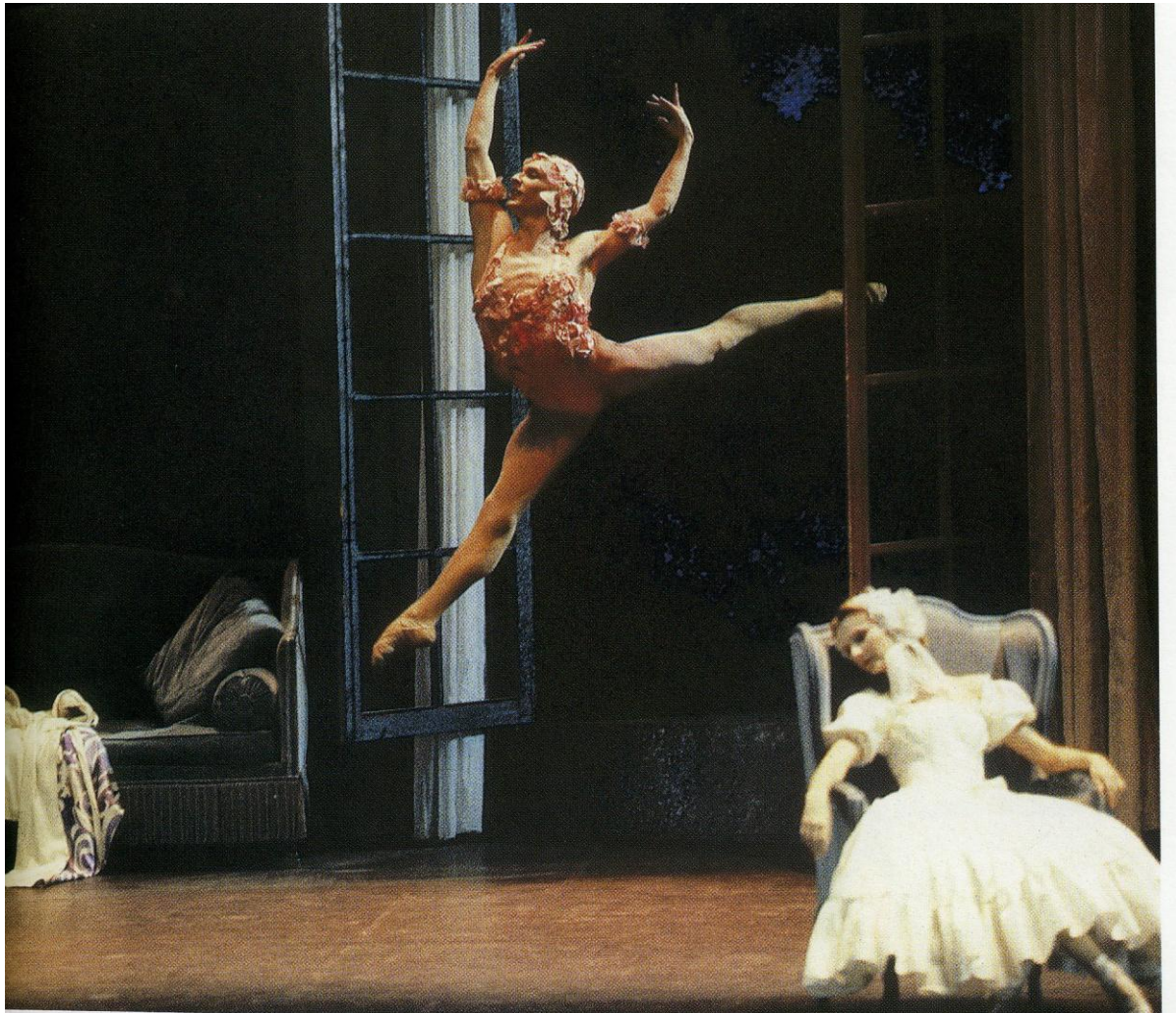
Le spectre de la rose, 1911 Mikhail Fokine